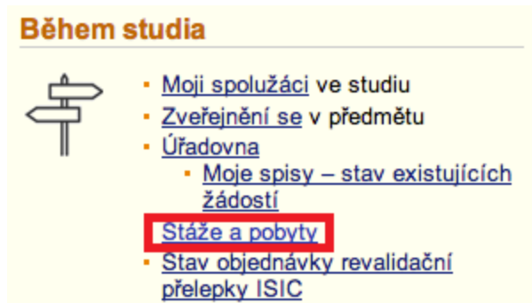
Obr. 1 - Aplikace pro evidenci stáží a pobytů