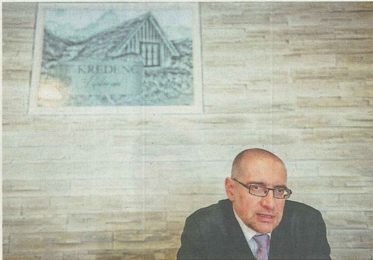
Nejlepší školou pro studium psychologie je Filozofická fakulta Masarykovy univerzity v Brně. (Na fotce rektor MU Mikuláš Bek.)

Jaké mají absolventi možnosti? Už nemusí zůstat jen u klasické psychologie a pracovat v nějakém medicínském či poradenském zařízení. Čím dál tím více se uplatňují i v soukromé sféře.